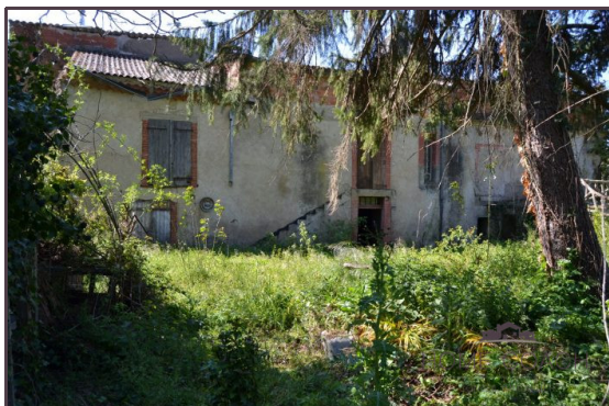
Facade coté jardin